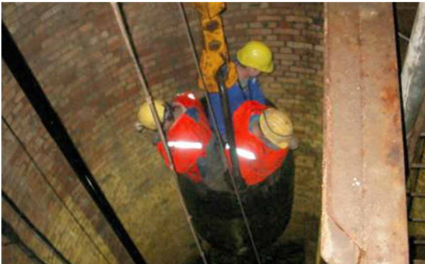
Kontrollbefahrung der Schachtröhre mit dem Kübel