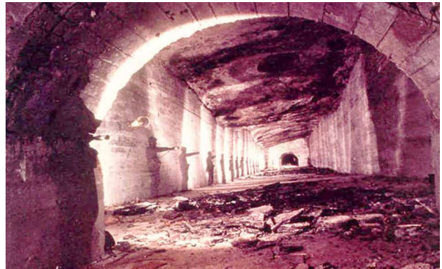
Untertägige Kammer im Salz (historische Ansicht)